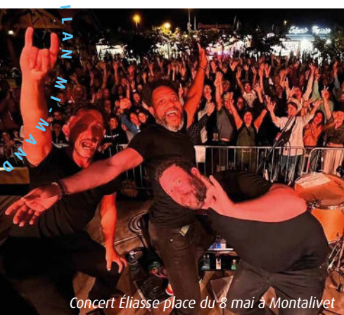
Concert Église place du 8 mai à Montalivet