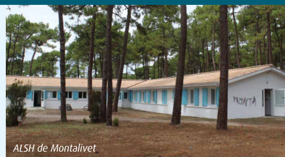
ALSH de Montalivet