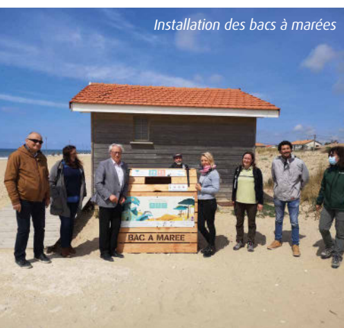
Installation des bacs à marées