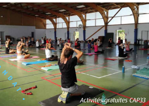
Activités gratuites CAP33